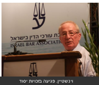
וינטשטיין. פגיעה בזכויות יסוד

מזהיר שהטלת חרמות וסנקציות על מי שפונה לרשויות המדינה, מהווה עבירה פלילית - קובע שהמדינה תוכל לקצף תמיכות לגופים שיציאו כתבי סירוב דרכי הטיפול של רשויות המדינה בכתבי סירוב המוצאים על ידי בית דין דתיים / החוות היעץ המשפטי לממשלה